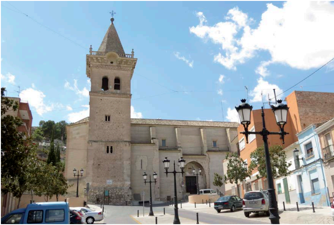
Fig. 1.– Yecla: Iglesia vieja de Nuestra Señora de la Asunción . Siglo XVI. Vista de la portada norte, fábrica del templo y torre-campanario. (Foto Concejalía de Cultura y Turismo de Yecla).

como los del escribano Ginés de los Ríos, que en 1588 dejó dos ducados para las obras del retablo mayor, y de Leonor Vicente, que en 1589 hizo lo propio con 100 reales 8 .