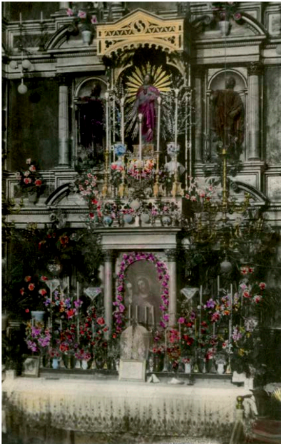
Fig. 3.- Retablo mayor de la Asunción. Detalle de la calle central con el tabernáculo y la pintura de un Cristo Eucarístico, de Alonso de Monreal. (Foto Salvador Cerezo, ca. 1926). La fotografía fue realizada con motivo de la festividad dedicada en la población al Sagrado Corazón de Jesús, una devoción contemporánea y en la que la figura de Jesús aparece ocupando circunstancialmente el centro del retablo en el día de su onomástica.