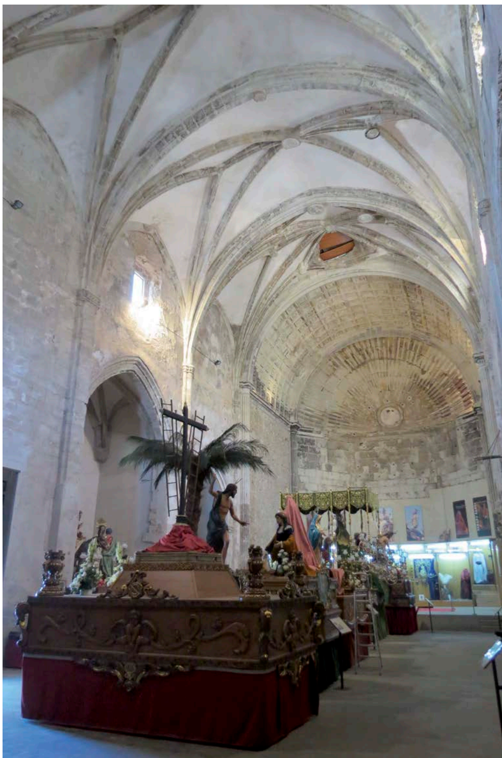
Fig. 5. - Yecla: Iglesia vieja de la Asunción . Interior de la nave del templo tras su restauración en las décadas de los años 80 y 90 del siglo XX, cuyo presbiterio se resiente hoy de la pérdida del retablo mayor. (Foto Concejalía de Cultura y Turismo de Yecla).